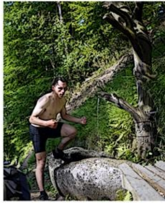
lever le pied...