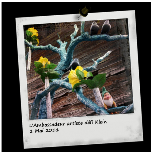
L'Ambassadeur artiste défi Klein 1 Mai 2011

[Harchinomak]-soit... Les voilas mes mollets... Mais après, faudra pas venir vous plaindre de nos déplorables relations internationales!