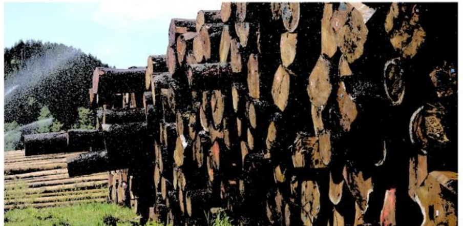
Recueillir au hasard de la nature, les émotions qui fondent les grandes architectures...