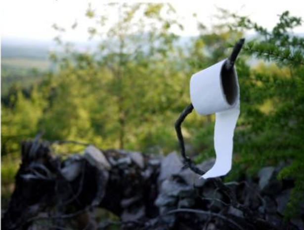
Il est temps de sacrifier au rituel du départ...