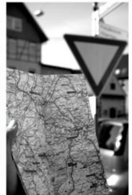
Rire d'une idée... Monter des sommets... Savourer... S'orienter... repartir...