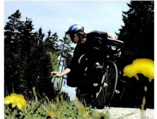
Traverser villages et paysages, "cueillir le jour" loin des oiseaux de passage...